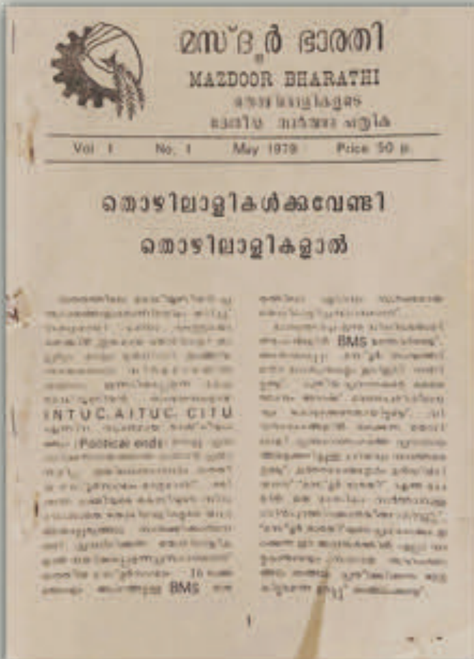
മസ്ദൂർ ഭാരതിയുടെ ആദ്യ ലക്കം