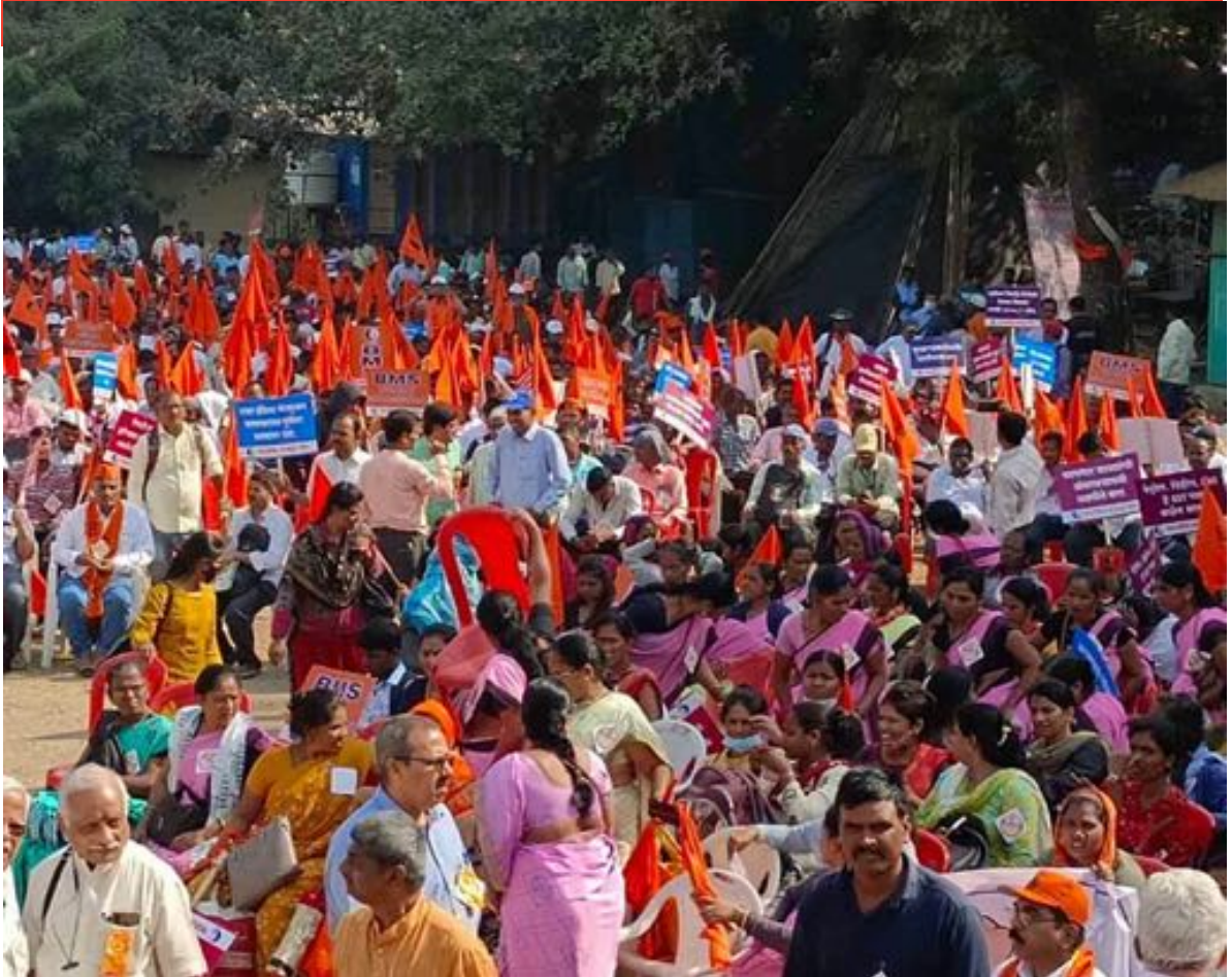
ആസാദ് മൈതാനിയിൽ നടന്ന ബി.എം.എസ്. പ്രതിഷേധ മാർച്ച്.