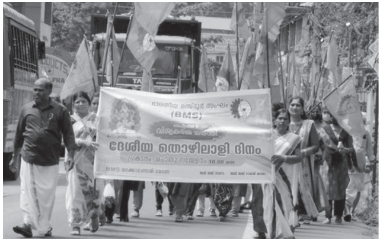
കൊഴിഞ്ഞാമ്പാറ: സംസ്ഥാനം ഭരിക്കുന്ന ഇടതുപക്ഷ സർക്കാർ