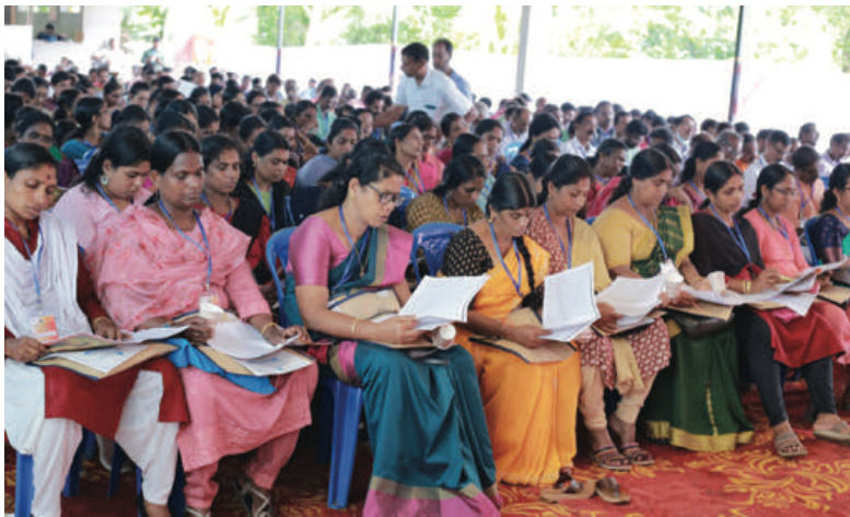
താനൂർ പുരപ്പറമ്പ് ഓഡിറ്റോറിയത്തിൽ നടന്ന ബി.എം.എസ്. മലപ്പുറം ജില്ലാ സമ്മേളനത്തിൽ പങ്കെടുത്ത പ്രതിനിധികൾ