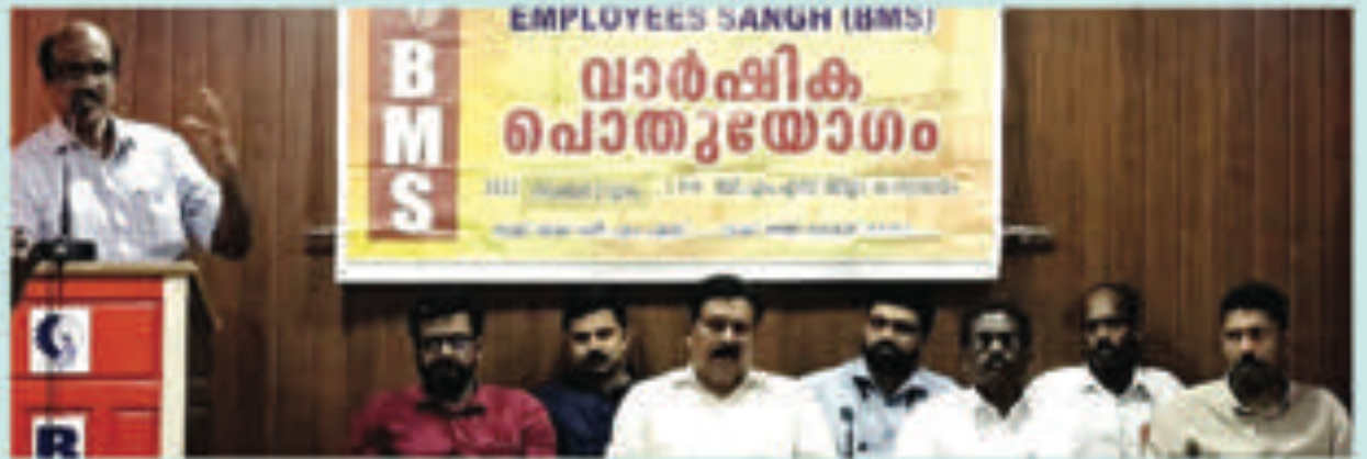
കിടയാൻബി എം.എം.ബിൻ സഹി വാർഷിക പൊതുയോഗം ബി.എം.എസ്. കെ.എം. കെ.എം സംഘ സംഘടനാ ബന്ധുവുറ്റി എം.പി.അമിൻ ഉദ്ദേശണം ചെയ്യുന്നു .