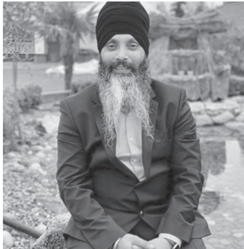
ഖാലിസ്ഥാൻ നേതാവ് ഹർദ്ദീപ്സിംഗ് നിജ്ജാർ

വെള്ളക്കാരന്റെ ഉത്തരവാദിത്വം (വൈറ്റ് മെൻസ് ബർഡൻ) എഴുതിയ ബ്രിട്ടീഷ് കവിയും നോവലിസ്റ്റുമായിരുന്ന റഡ്യാർഡ് കിപ്ലിങ് (Rudyard Kipling)- ആ കവിത എഴുതാനിടയായ സന്ദർഭം അമേരിക്കയും ഫിലിപ്പിനോകളും തമ്മിലുള്ള യുദ്ധമായിരുന്നു. യുദ്ധത്തിൽ ഫി