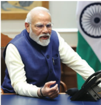
തുരങ്കത്തിൽ നിന്നും രക്ഷിക്കപ്പെട്ട തൊഴിലാളികളുമായി പ്രധാനമന്ത്രി നരേന്ദ്രമോദി ആശയവിനിമയം നടത്തുന്നു.

ഉത്തരകാശിയിലെ ഓപ്പറേഷൻ സിൽക്യാരയുടെ വിജയത്തിൽ നിർണ്ണായക പങ്ക് വഹിച്ച ധീരരായ പ്രവർത്തകർക്ക് ഞങ്ങൾ ആത്മാർത്ഥമായ നന്ദി രേഖപ്പെടുത്തുന്നു. ഉത്തരകാശിയിലെ പൗരന്മാരുടെയും മുഴുവൻ രാജ്യത്തിന്റെയും സുരക്ഷ ഉറപ്പാക്കാനുള്ള സർക്കാരിന്റെ ശ്രമങ്ങളിൽ ഇനിയും വിജയമുണ്ടാകട്ടെ എന്നാശംസിക്കുന്നു.