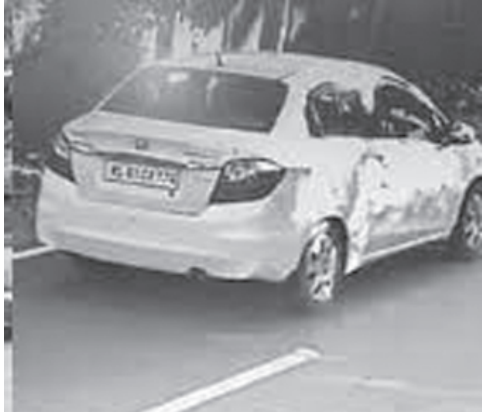
കുട്ടിയെ തട്ടിക്കൊണ്ടുപോകാൻ ഉപയോഗിച്ച കാർ

പ്രതികളെ തിരയാൻ പോലീസ് വലവിരിച്ചു എന്നു പറയുമ്പോഴും യാതൊരു കൂസലുമില്ലാതെ പ്രതികൾ ഒരു കടയിൽനിന്ന് ബിസ്ക്കറ്റ് വാങ്ങുകയും കുട്ടിയുടെ വീട്ടിലേക്ക് കടയിലെ ഫോണിൽ നിന്ന് വിളിക്കുകയും മോചനദ്രവ്യം ആവശ്യപ്പെടുകയും ചെയ്തു. പിറ്റേദിവസം പ്രതികൾ മാസ്ക് ധരിച്ച് ഓട്ടോറിക്ഷയിൽ കയറി കൊല്ലം നഗരത്തിലെ ആശ്രാമം മൈതാനത്ത് കുട്ടിയെ കൊണ്ടുവന്നിരുന്നതിനെ കുട്ടിയെ കുറച്ചു നേരം നിരീക്ഷിച്ച് സ്ഥലം വിട്ടു.