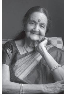
കർണാടക സംഗീത ജന്തയും അഭിനേ ത്രിയുമായിരുന്ന ആർ.സുബ്ബലക്ഷ്മി.