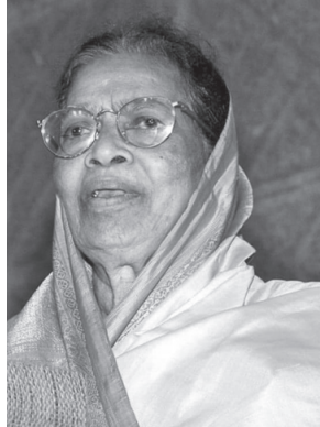
സുപ്രീം കോടതി ആദ്യ വനിതാ ജഡ്ജിയും തമിഴ്നാട് ഗവർണ്ണറുമായിരുന്ന എം.ഫാത്തിമാ ബീബി.