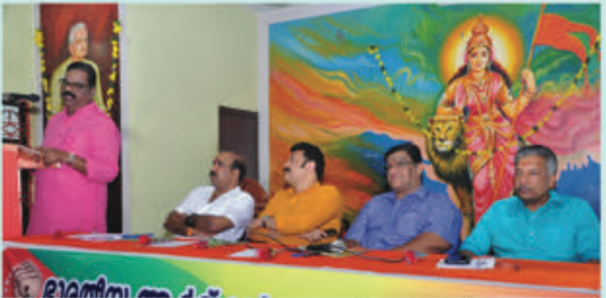
അമിൻ ബുക്റ്റ് വർഷങ്ങൾക്ക് സംഘ പ്രഥമ സംസ്ഥാന സമ്മേളനം ബി.എം.എസ്. ബന്ധുവുറ്റി അനൽ ബന്ധുവുറ്റി ബി.എം.എസ്. അമിൻ ഉദ്ദേശണം ചെയ്യുന്നു