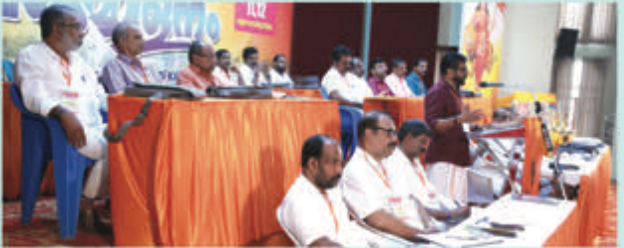
ബി.എം.എസ്.കോർപ്പറേറ്റ് ജില്ലാ സമ്മേളന സംസ്ഥാന അനൽ ബന്ധുവുറ്റി ബി.കെ.അമിൻ ഉദ്ദേശണം ചെയ്യുന്നു